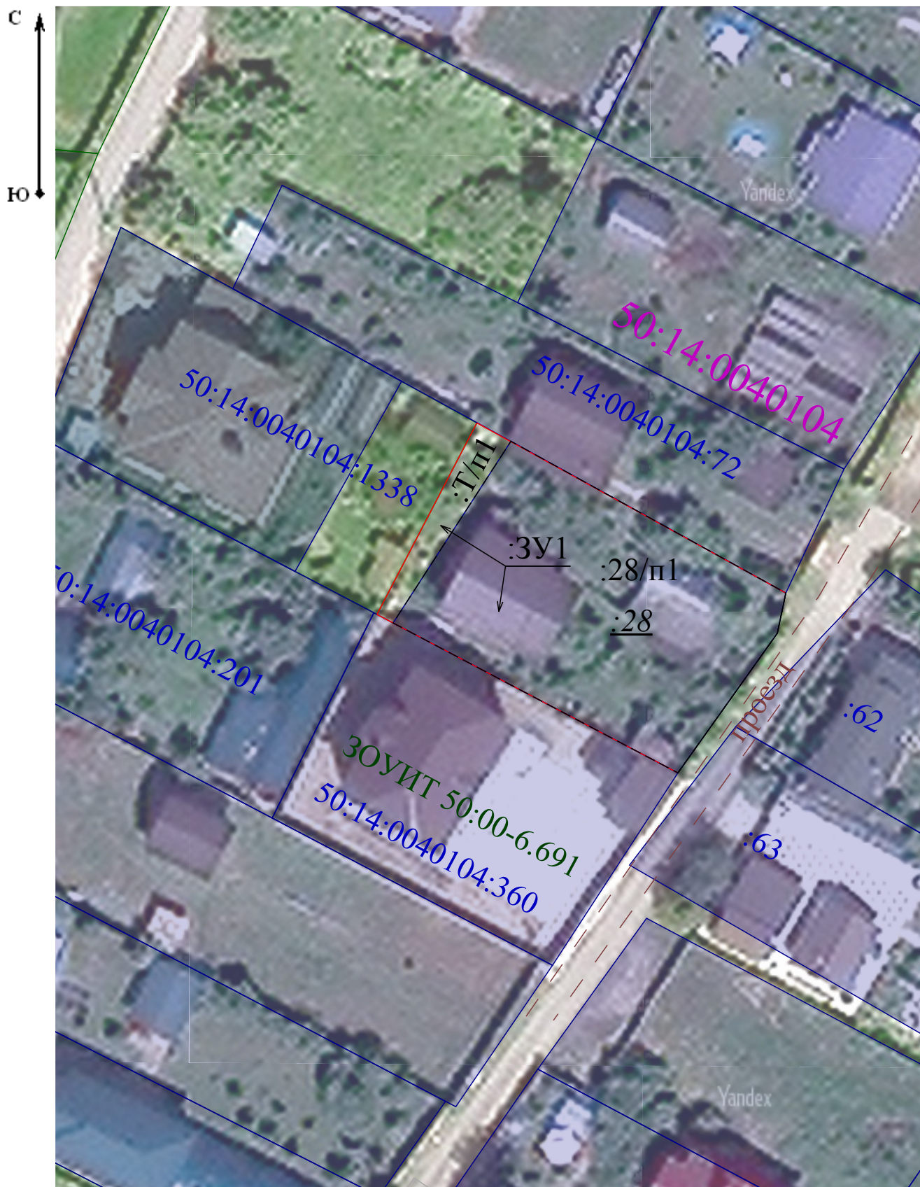
Схема расположения земельных участков

условные обозначения представлены на листе № 1